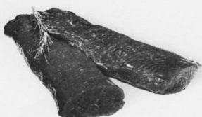
Lammierstück per 100 g, regionale Preise

Wildrice Mix 4x 125 g, Fr. 3.90 Erhältlich in grösseren Filialen.